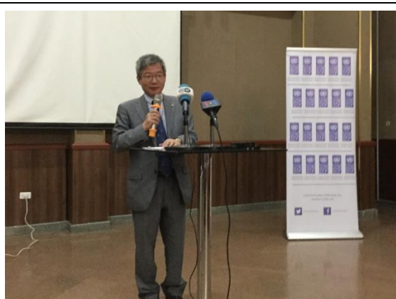
松永大使によるオープニングスピーチ

7 月 9 日、松永大使は、ハワサを訪問し、平和省、国家災害リスク管理委員会 (NDRMC)、UNDP、現地自治体等と共に同プロジェクトの活動計画、実施方法及び成果について意見交換を行いました。