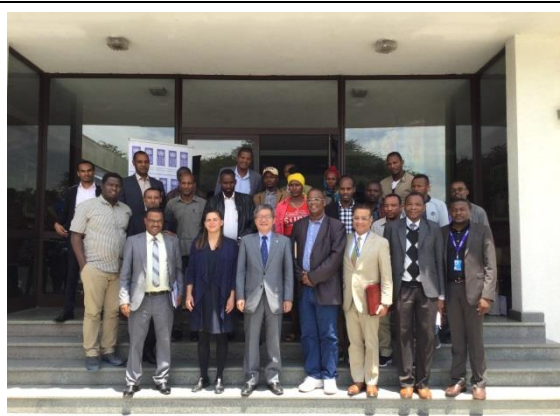
参加者との集合写真