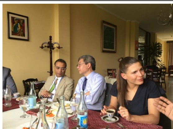
昼食を交えての意見交換