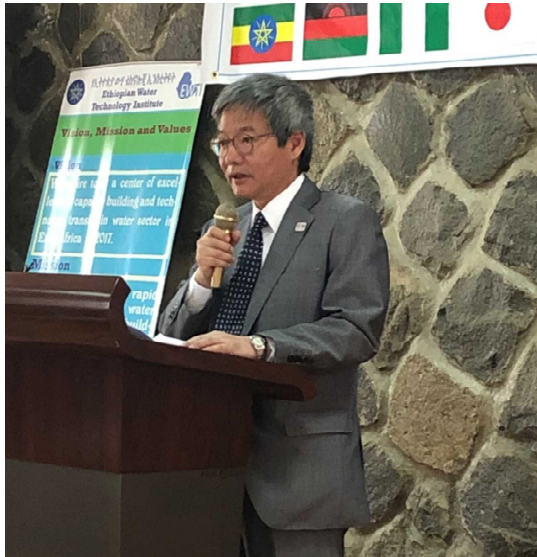
松永大使による挨拶

開講式には、シレシ水・灌漑・エネルギー大臣、ネガシュ水・灌漑・エネルギー国務大臣、タメネ EWTI 総裁といったエチオピア政府要人が出席しました。