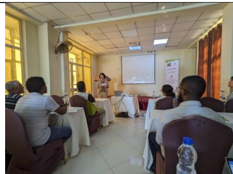
挨拶する堤書記官と参加者